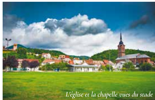
L'église et la chapelle vues du stade

Composée de 12 lots d'appartements du studio au 2 pièces, le programme "Les Acacias" propose une architecture agréable et bien orientée.