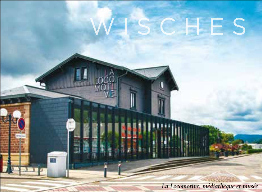
La Locomotive, médiathèque et musée

Médiathèque, musée, école, supermarché, pharmacie, boulangerie pâtisserie... Toutes les commodités de Wisches