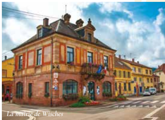
La mairie de Wisches

Avec une population de 2 116 habitants, le village a su garder son patrimoine historique tout en se développant pour répondre aux besoins d'aujourd'hui. Il reste facile d'accès par la voie express de la Bruche.